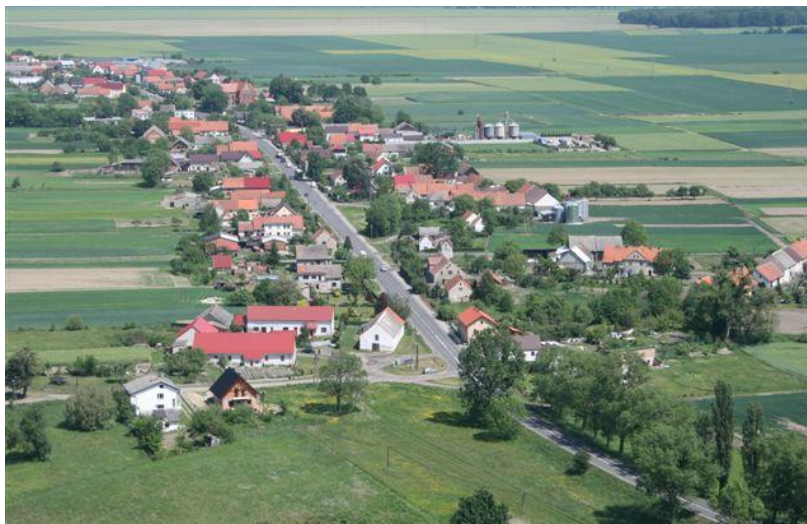
Liniowy układ zabudowy wsi Stary Grodków

Działki zagrodowe zabudowane są najczęściej w sposób tradycyjny obiektami pochodzącymi głównie z lat dwudziestych i trzydziestych dwudziestego wieku. Na obszarze wsi pozostała także niewielka ilość obiektów pochodzących najprawdopodobniej z wieku XIX. Najczęściej od strony drogi na działkach zlokalizowane są budynki mieszkalne. Za nimi w układzie liniowym zblokowane są budynki gospodarcze przeznaczone głównie do produkcji zwierzęcej nad budynkami mieszkalnymi i gospodarczymi znajdują się dwuspadowe dachy, o kącie pochylenia połaci dachowych w stosunku do poziomu około 35-45°.