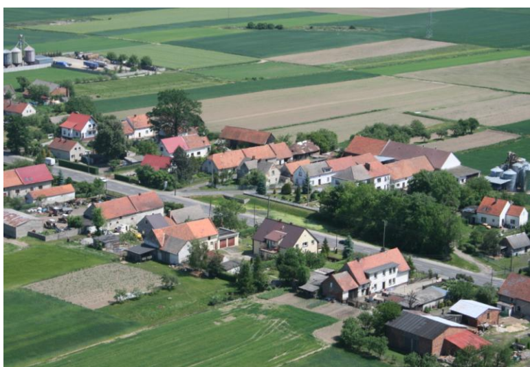
Budynki zblokowane w układzie liniowym

Działki zagrodowe zabudowane są najczęściej w sposób tradycyjny obiektami pochodzącymi głównie z lat dwudziestych i trzydziestych dwudziestego wieku. Na obszarze wsi pozostała także niewielka ilość obiektów pochodzących najprawdopodobniej z wieku XIX. Najczęściej od strony drogi na działkach zlokalizowane są budynki mieszkalne. Za nimi w układzie liniowym zblokowane są budynki gospodarcze przeznaczone głównie do produkcji zwierzęcej nad budynkami mieszkalnymi i gospodarczymi znajdują się dwuspadowe dachy, o kącie pochylenia połaci dachowych w stosunku do poziomu około 35-45°.