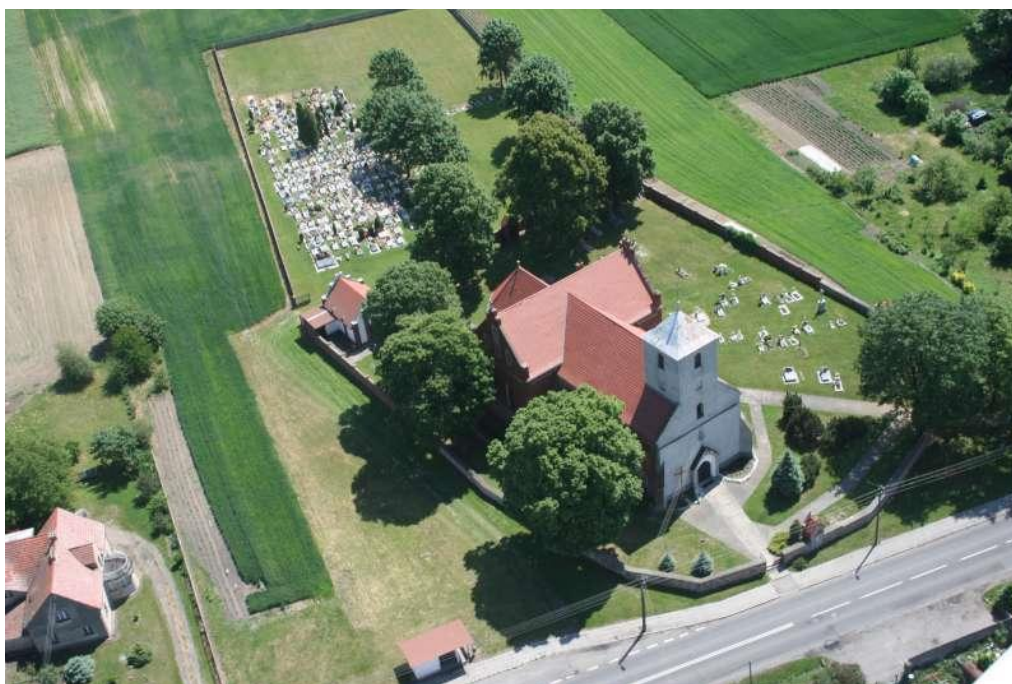
Kościół p.w. Św. Trójcy w Starym Grodkowie