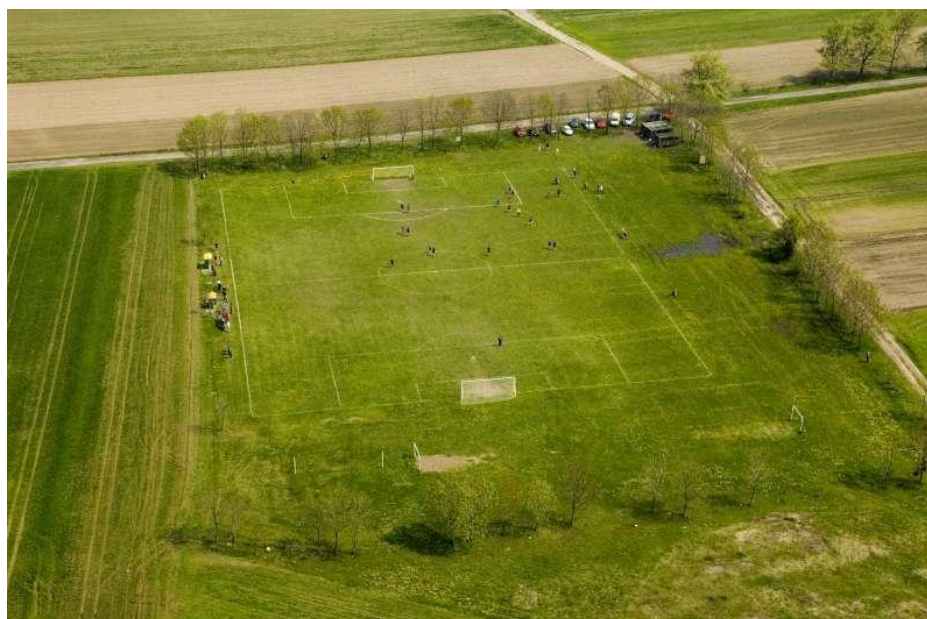
Boisko sportowe w Starym Grodkowie