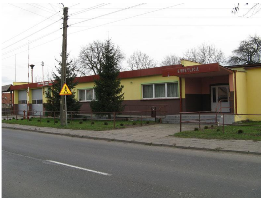
Budynek świetlicy wiejskiej i siedziba OSP Stary Grodków