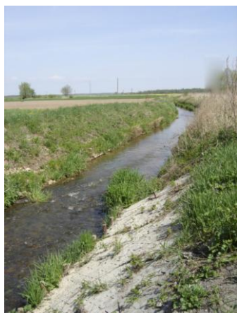
Fot. Rzeka Stara Struga – Stary Grodków.

Tereny wsi należących do gminy, położonych na wysoczyźnie polodowcowej i najwyższej terasie Nysy Kłodzkiej, charakteryzują się niewielką gęstością sieci rzecznej. Z zachodu do Nysy Kłodzkiej spływają liczne ciek, odwadniające obszary wsi, wśród których na wyróżnienie zasługuje Cielnica (odwadnia Makowice oraz Giełczyce), Skoroszycki Potok (często nazywany Młynówką, która jest jego dopływem, odwadnia Skoroszyce, Mroczkową, Brzeziny, część wsi Czarnolas) oraz Stara Struga (Stary Grodków, Pniewie, część wsi Czarnolas). Rzeki te płyną w kierunku wschodnim lub północno – wschodnim, gęstość ich sieci jest tu niewielka i wynosi ok. 0,4 – 1,0 \text{km}/\text{km}^2 . Wododziały zlewni są wyraźne na wysoczyźnie i ztracają się na terasach nadzalewowych Nysy Kłodzkiej.