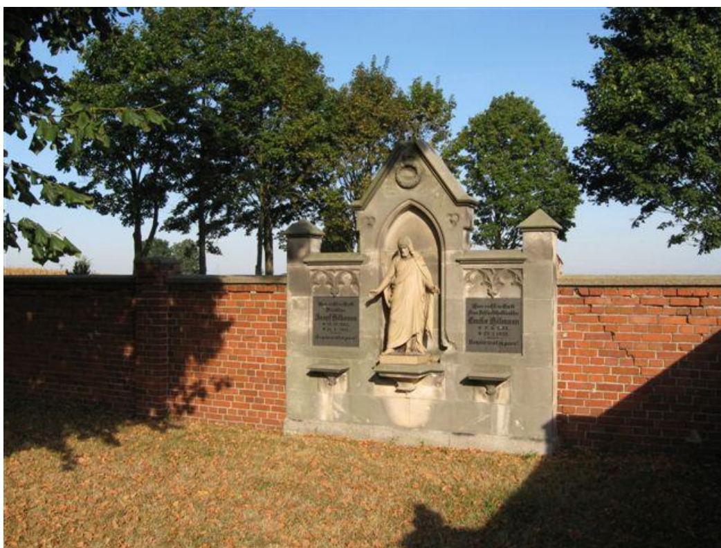
Kapliczka przy murze kościoła w Starym Grodkowie