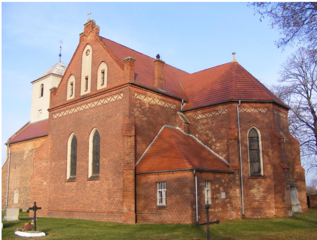
Kościół p.w. Św. Trójcy w Starym Grodkowie