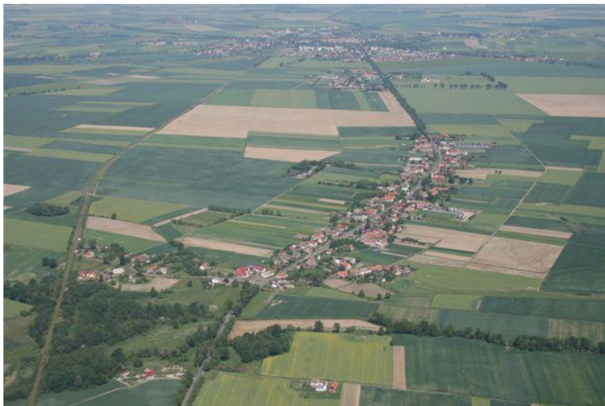
Panorama Stary Grodków

zwłaszcza o roślinność na ziemiach uprawnych, gdzie obecnie występuje przewaga: zbóż (najczęściej uprawia się pszenicę, oraz jęczmień, zwłaszcza jary w mniejszej ilości jęczmień ozimy, można także spotkać uprawiany dla paszy owies, dość duża powierzchnia uprawna wykorzystywana jest pod kukurydzę, inne zboża w okolicach raczej nie występują), buraków cukrowych (pastewnych raczej się już nie spotyka), ziemniaków, oraz duże ilości rzepaku, zaniwiają natomiast łąki. Jeśli chodzi o lasy to pierwszy rozdziela Stary Grodków od chróścińskiego osiedla Zacisze. Rozciąga się on na południowym-zachodzie wioski. Drugi większy kompleks leśny znajduje się na wschodzie Starego Grodkowa, oddzielając go od Kopic. Obydwa lasy stanowią pewną całość, którą przedziela kilkusetmetrowy bezleśny pas. Są to lasy liściaste z niewielkimi kompleksami drzew iglastych. W lesie można spotkać tak rzadkie rośliny jak: czworolist pospolity i kopytnik pospolity. Pobliskie tereny są dosyć bogate nie tylko w florę, ale także w faunę. Przykłady świata zwierząt, które dość często można spotkać nie tylko w okolicznych lasach, ale także i na polach uprawnych, to liczne: lisy, zające, sarny, dziki. Oczywiście to tylko najbardziej znani przedstawiciele pobliskiej przyrody.” (źródło: Damian Latocha „Parafia Trójcy Świętej...”)