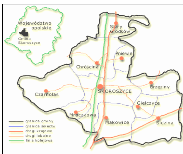
Rys. 1. Lokalizacja sołectwa Stary Grodków na tle Gminy Skoroszyce

Wieś Stary Grodków jest położona w południowo - zachodniej części województwa opolskiego w gminie Skoroszyce, 20 km na północ od Nysy (miasto powiatowe), 7 km od Skoroszyca i 3 km od Grodkowa. Wieś położona jest w północnej części gminy Skoroszyce. Przez jej teren przebiega droga wojewódzka nr 401, a także linia kolejowa. Obok sołectwa znajduje się przystanek kolejowy obsługi ruchu pasażerskiego. Układ przestrzenny wsi - wieś o układzie ulicówki z przeważającą zabudową zagrodową.