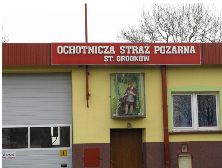
Budynek świetlicy wiejskiej i siedziba OSP Stary Grodków